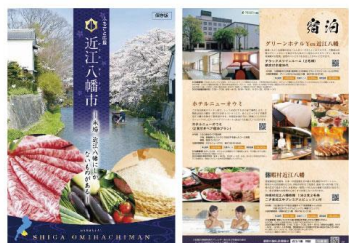
ガイドブック・ウェブサイト