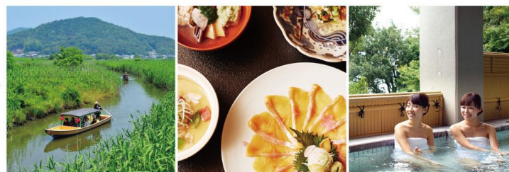
市内の観光サービス（体験・飲食・宿泊・運送 etc.）