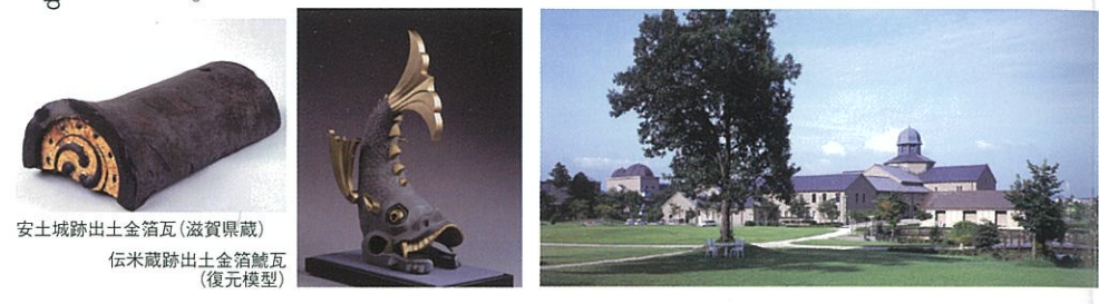
安土城跡出土金箔瓦(滋賀県蔵) 伝米蔵跡出土金箔瓦(復元模型)

開館時間 午前9時～午後5時 (入館は午後4時30分まで) 入館料 一般(常設展)5000円 (企画展)6000円 休館日 月曜日(祝休日の場合は翌日) 年末年始(12月28日～1月4日) 住所 近江八幡市安土町下豊浦6678 URL https://www.azuchi-museum.or.jp/ 問合せ先 TEL:0748462424