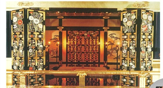
天主6階部分 十五日おちつき膳