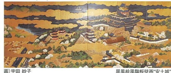
屏風絵風陶板壁画「安土城」 画)宇田 妙子

開館時間 午前9時～午後5時 (入館は午後4時30分まで) 入館料 一般200円(1500円) 高校生1500円(1000円) 小学生1000円(500円) ※(内)は20名以上団体料金特典。入館された方は、喫茶メニューの割引があります！ 休館日 月曜日(祝休日の場合は翌日) 年末年始(12月28日～1月4日) 住所 近江八幡市安土町中700 問合せ先 TEL:0748466016