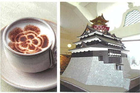
家紋カプチーノ 1/20安土城(内藤 昌復元)

●喫茶では、人気のオリジナル家紋カプチーノ等を揃えており、入館者には飲み物の割引特典がついてきます。