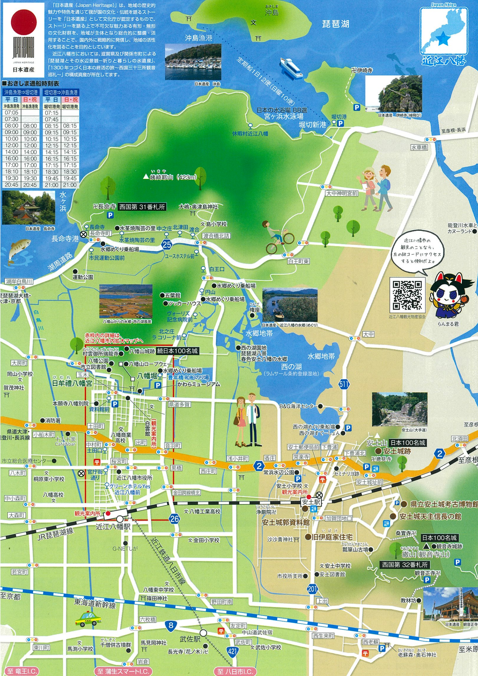
日本遺産 観音正寺