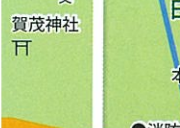
日本遺産 観音正寺