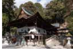
⑪鎌倉時代に創建された拝殿・本殿

☎0748-32-3151 ⑩ 近江八幡市内宮内町257 ⑩ 市営小幡観光駐車場利用