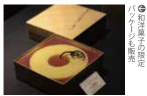
⑯和洋菓子の限定パッケージも販売

☎0748-33-6666 ⑭ 近江八幡市北之庄町 615-1 ⑮9~18時(フードコートは10~17時) ※店舗により異なる⑯元日⑰650台