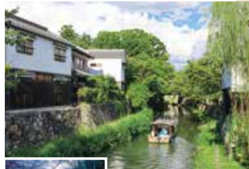
①船が行き交う八幡堀の風景 ②夜間ライトアップの様子

☎0748-33-6061 (近江八幡駅北口観光案内所) ⑧ 近江八幡市内宮内町一帯 ⑨ 市営小幡観光駐車場利用