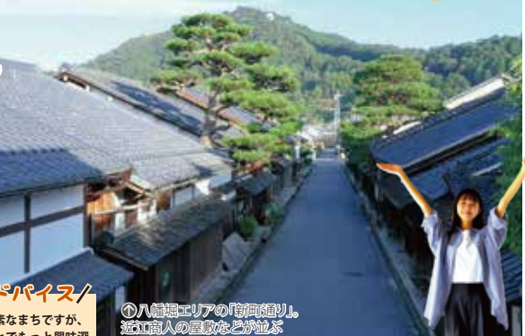
①八幡堀エリアの「時雨鐘り」、近江商人の屋敷などを並ぶ

巡り方アドバイス 近江八幡はとても質素なまちですが、歴史や物語を知ることでもっと興味深く巡ることができます。我々観光ガイドのご利用もおすすめです。